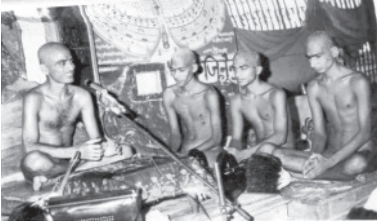
दीक्षा के उपरान्त बैठे मुनिराज त्रय

आचार्यश्री और नवदीक्षित साधकों के जयकारों से आकाश गूँज उठा। इन्द्रदेव ने भी पुष्प वृष्टि के रूप में जल वृष्टि कर अपनी भक्ति निवेदित कर दी।