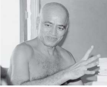
आचार्य श्री विद्यासागरजी महाराज

उन्हें अहसास हुआ कि वे भटक गये हैं। इस बीच चार बंदूकधारी लोगों ने उन्हें घेर लिया। गाड़ी में बैठे सभी यात्री घबरा गये। एक यात्री ने थोड़ा साहस करके कहा कि “भैया, हम जयपुर से आए हैं। आचार्य विद्यासागर महाराज के दर्शन करने जा रहे हैं, रास्ता भटक गए हैं, आप हमारी मदद करें।” उन चारों ने एक-दूसरे की ओर देखा और उनमें से एक रास्ता बताने के लिए गाड़ी में बैठ गया।