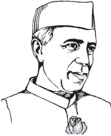
Pt. Jawaharlal Nehru 1889-1964

Title Verification No. : UPENG 03049/24/1/2005-TC