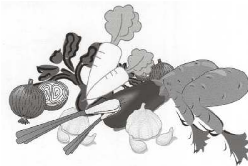
(Underground Roots & Stem)

इस तरह हम देखें तो आलू में स्टार्च, लेन्टीसेल्स और आइवड्स—ये तीनों चीजें बैक्टीरिया और इन्सेक्ट्स की अधिकता को दर्शाती हैं। यही कारण है कि आलू में अधिक हिंसा होने की संभावना को देखते हुए जैनधर्म में उसके त्याग पर जोर दिया गया है।